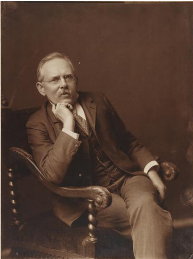
Jacob A. Riis, 1903

I 1877 fik Riis arbejde som politireporter på avisen New York Tribune . Det var et hårdt, farligt og krævende arbejde, der bl.a. førte Riis ind i New Yorks slumkvarterer. Her åbnede der sig en mørk og brutal verden med kriminalitet, sygdom og fattigdom - en verden, som han i sin tid som hjemløs immigrant selv havde stiftet bekendtskab med, og som han stadig havde svært ved at ryste af sig. Den var med til at forme Riis' arbejde som journalist og hans arbejde for at forbedre vilkårene for New Yorks fattigste.