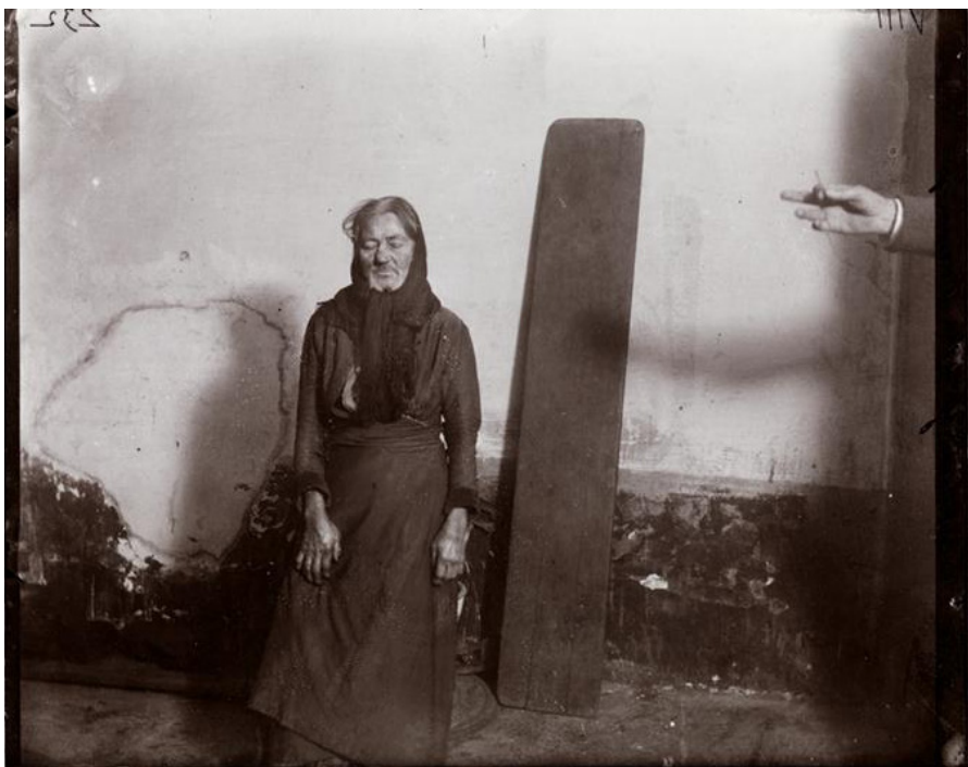
Ældgammel logerende på politistationen på Eldridge Street – en "skrubber", 1892-1893

I en artikel fra 1893 beskriver Jacob A. Riis samme type kvinde som hende, der ses på fotografiet, således: