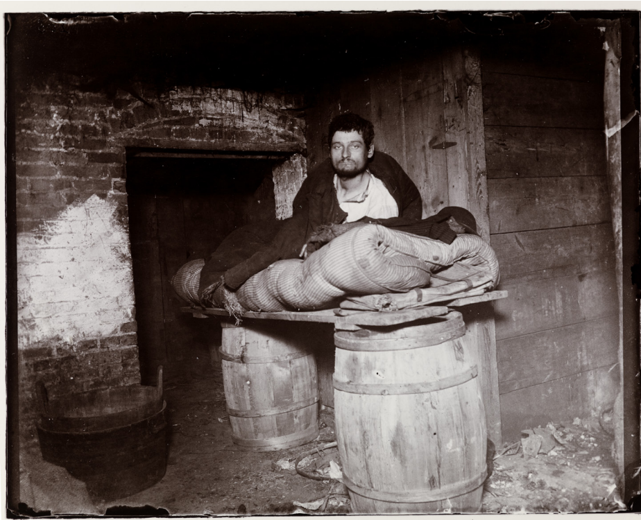
Gadesælger som sov i kælderen på Ludlow Street 11, 1892, Museum of the City of New York, 90.13.3.33

Se på fotografiet, Gadesælger som sov i kælderen på Ludlow Street 11 . Baggrunden er lidt ubestemmelig; bag manden synes der at være en mur med en døråbning. Til hvad kan vi ikke se. Gulvet er nusset og det ligner, at det flyder med skrald. Manden ligger på et bræt på to tønder. Under sig har han noget, der ligner en beskidt madras. Det virker som om, at manden lige er vågnet.