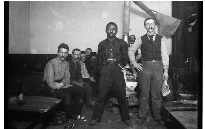
East 22nd Street Station, hvor der udbrød tyfus, 1893, Museum of the city of New York. 90.13.1.242