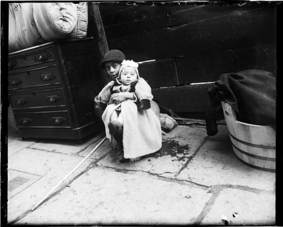
Børnepasning, Cherry Hill, 1892