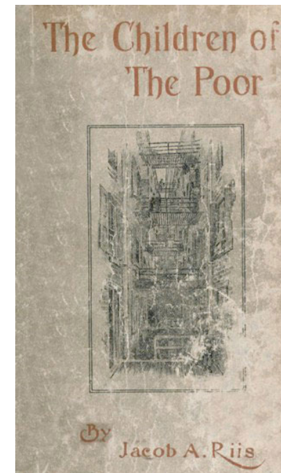
The Children of the Poor , 1892

I arbejdet med Children of the Poor introducerede Riis sig for nogle af børnene, før han fotograferede dem. Han spurgte ind til deres liv og fik indsigt i personlige historier, som han indarbejdede i sine artikler og bøger. På den måde kunne Riis viderebringe de ulykkelige historier til sine læsere, som fik et unikt indblik i de liv slumbørnenes ufrivilligt førte. Fotografiet spillede en stor rolle i forhold til at fortælle børnenes historier.