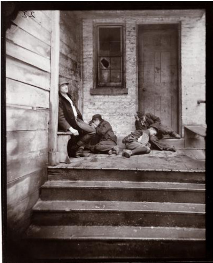
Gadebørn i natlogi, Mulberry Street, 1887-1888, Museum of the City of New York, 90.13.4.16

I sine fotografier fik Riis nogle gange børn og voksne til at posere. På den måde kunne Riis skabe det perfekte billede - altså et billede, som udtrykte lige netop dét, han ønskede.