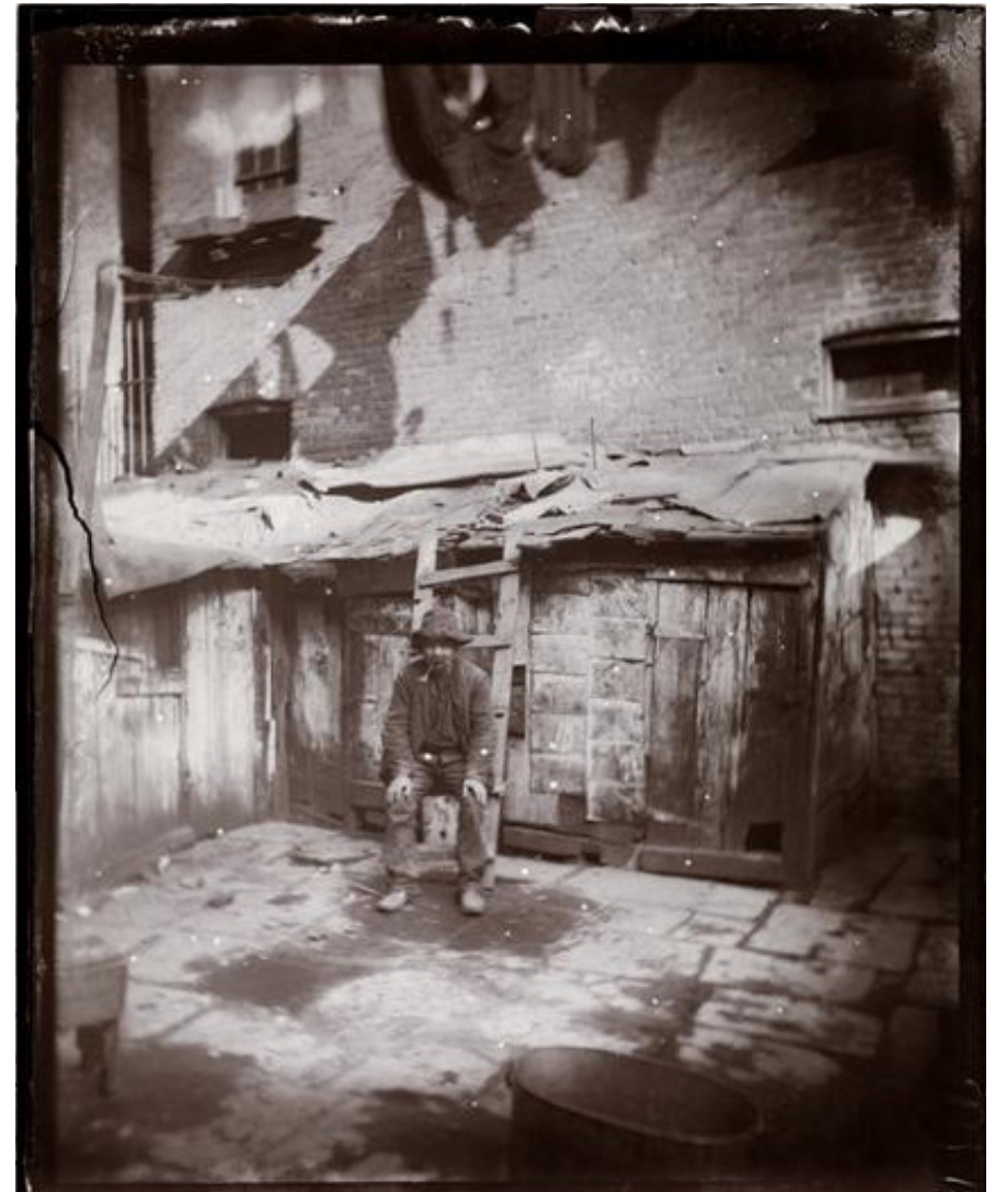
Vagabond i baggård på Mulberry Street, 1887-1888, Museum of the City og New York, 90.13.4.94

I dag beskrives Riis' arbejde som radikalt og banebrydende: Ingen reportere havde før bevæget sig så langt ind i New Yorks fortiede slumkvarterer - steder, som få kendte til - og ingen havde før brugt fotografiet så indgående til at skabe opmærksomhed til en bestemt politisk sag: At forbedre de fattiges vilkår.