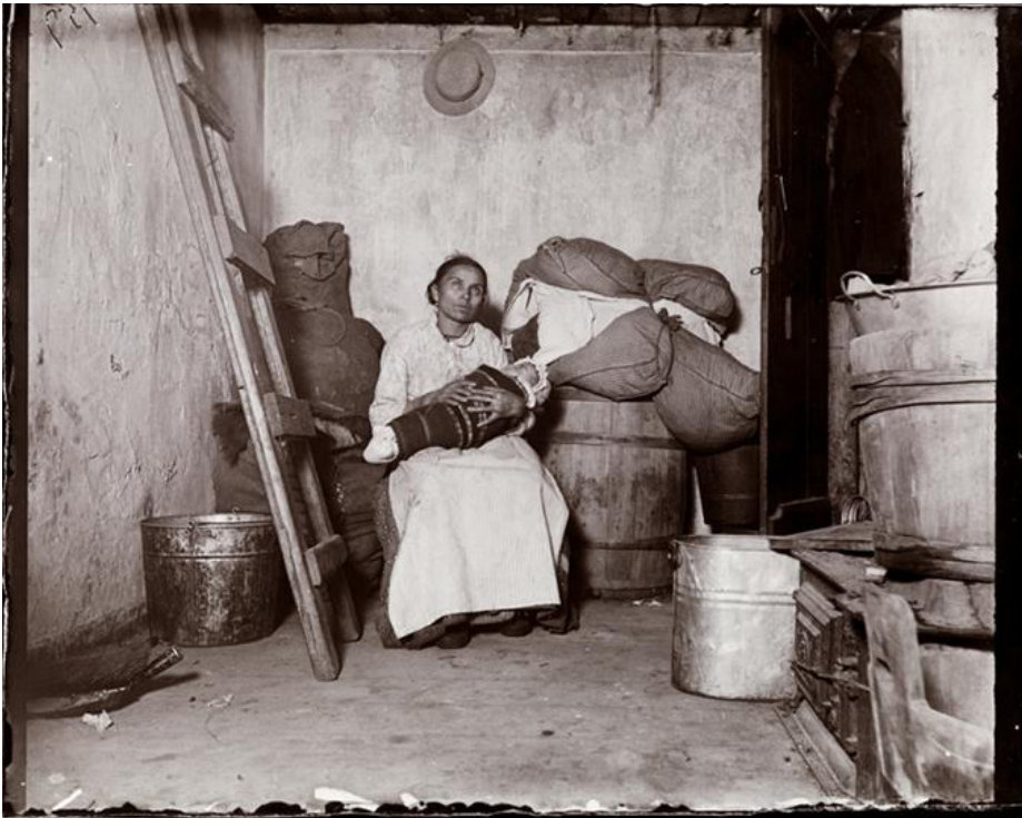
Italiensk mor med sit spædbarn på Jersey Street, 1888-1889, Museum of the city of New York, 90.13.4.160