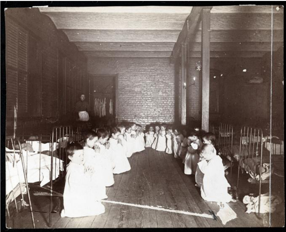
Bedestund på sovesalen, Five Points House of Industry, 1887-1888

På fotografiet Bedestund på sovesalen, Five Points House of Industry ser man en gruppe små børn på et børnehjem. Riis har fanget dem med sit kamera under aftenbønnen. De sidder i hvide natkjoler i et mørkt rum, hvor de hver især er fordybede i deres bøn.