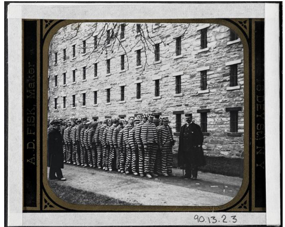
Blackwell's Island, fanger i tætte geledder, 1887-1888