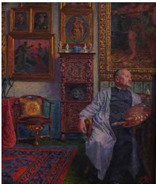
Selvportræt i hjemmet, 1916

I materialet undersøger vi, hvordan opfattelsen af køn og seksualitet har ændret sig fra Zahrtmanns tid til i dag. Vi undersøger også, hvordan hans kunstværker taler ind i samfundsdebatter og udfordrer den måde, vi tænker og tidligere har tænkt på os selv og hinanden.