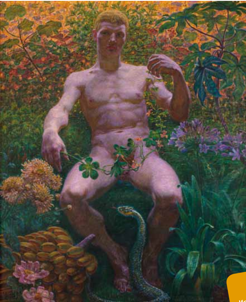
Adam i Paradis , 1914. Privateje.

Adam og Eva er fortællingen om menneskets skabelse. Det er også fortællingen om, at der findes to forskellige køn, manden og kvinden, og at de to køn supplerer* hinanden. Og så er det en fortælling, som er blevet brugt til at retfærdiggøre mænds højere sociale status. Ofte bliver Adam og Eva malet sammen, men i Zahrtmanns maleri sidder Adam alene med den lumske slange.