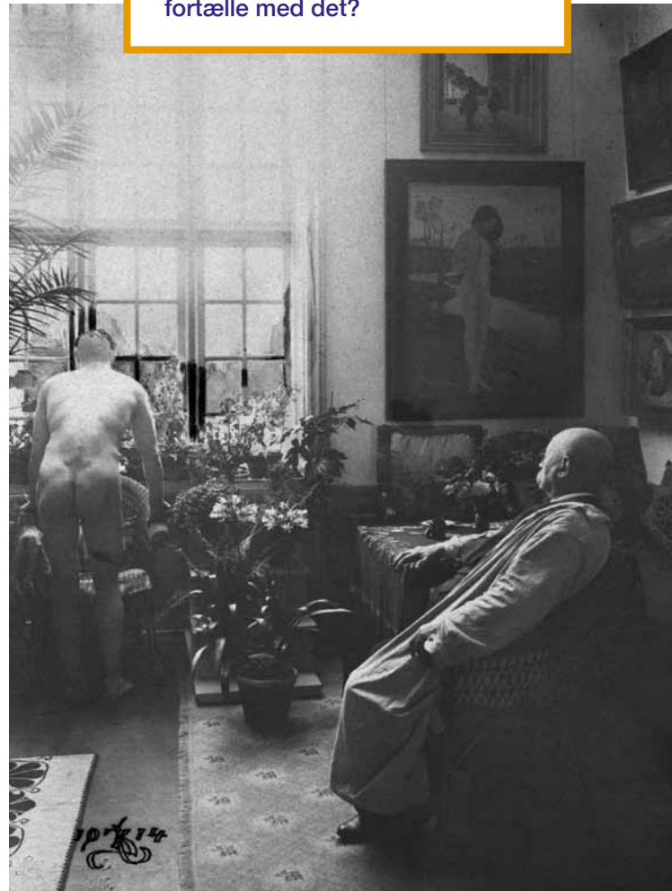
Kristian Zahrtmann i sit atelier, 1914.

Tror du, at fotografiet fra atelieret er iscenesat af Zahrtmann selv? Og i så fald: Hvad ville han mon fortælle med det?