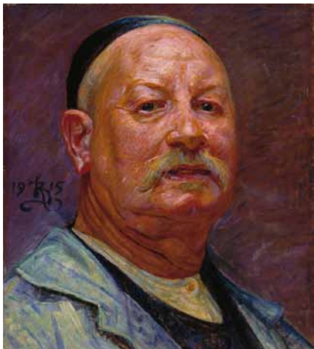
Selvportræt, 1915 Finlands Nationalgalleri, Ateneum www.kansallisgalleria.fi , public domain

Selvportrætter handler om at fortælle verden, hvem man er. De viser ofte, hvordan man ser ud udenpå, men også hvordan man er indeni. Man kan sige, at de på den måde afspejler en persons identitet. Selvportrætter er altså aldrig neutrale spejlbilleder. De vil altid være udtryk for en række valg såsom posering, mimik, tøj, baggrund, farver osv. Ofte handler selvportrætter om, at man gerne vil have andre mennesker til at tro, man er på en bestemt måde. De kan altså også vise, hvem man godt kunne tænke sig at være.