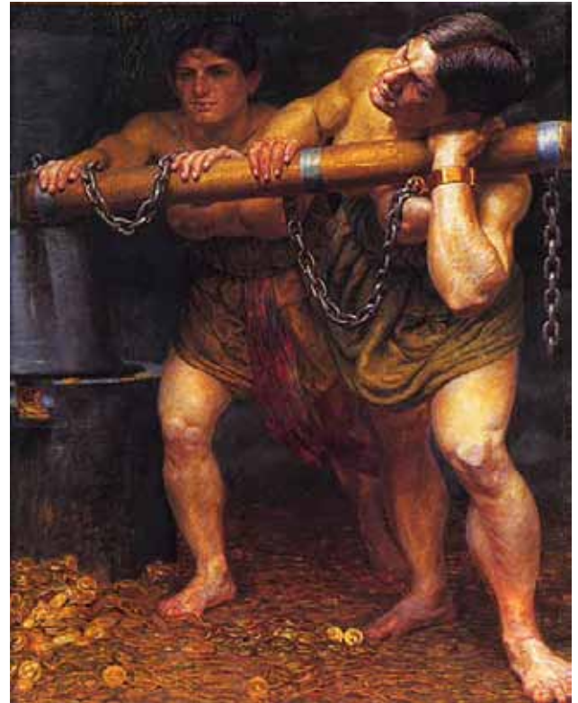
Jættepigerne Fenja og Menja male Guld, 1906. Privateje

Fenja og Menja er i den nordiske mytologi to stærke jætter*, som den danske kong Frode sætter til at male rigdom og lykke på den magiske kværn Grotte. Da kongen går over gevind og udnytter kvindernes arbejdskraft, beslutter de sig i stedet for at male død og ødelæggelse over ham.