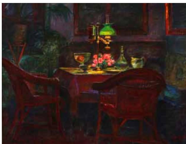
Interiør fra Casa d'Antino. Kurvestole ved et bord, hvorpå en tændt lampe, 1916. Privateje