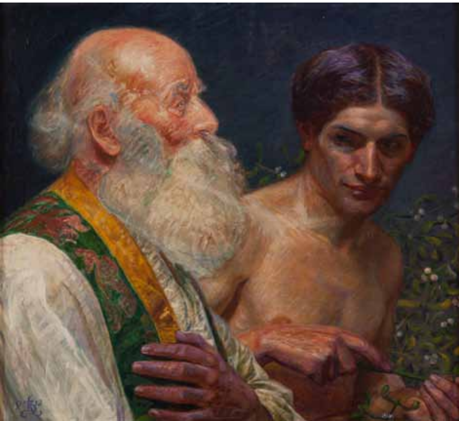
Loke viser Alfader Misteltenen, 1912. Privateje.