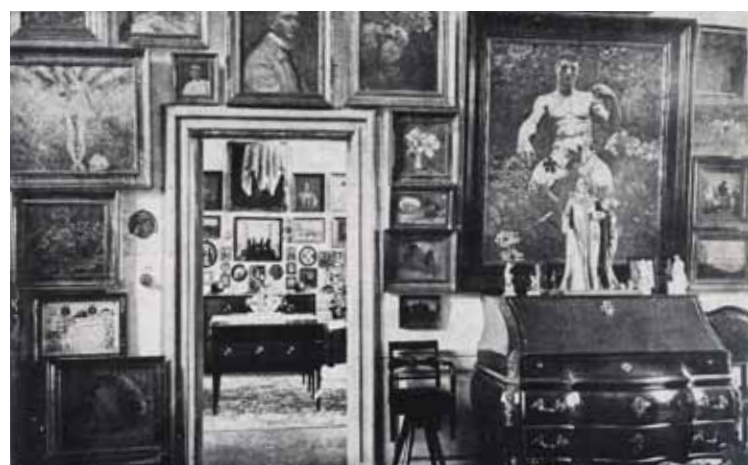
Fotografi fra Kristian Zahrtmanns hjem, 1912-17 Original i Den Hirschsprungske Samling Genoptaget af SMK Foto/Jakob Skou-Hansen © Ukendt kunstner/VISDA

Zahrtmann var meget glad for blomster – både for at se på dem og for at male dem. Da han flyttede ind i sit nye hus på Frederiksberg, sørgede han derfor for, at der var en lille blomsterhave.