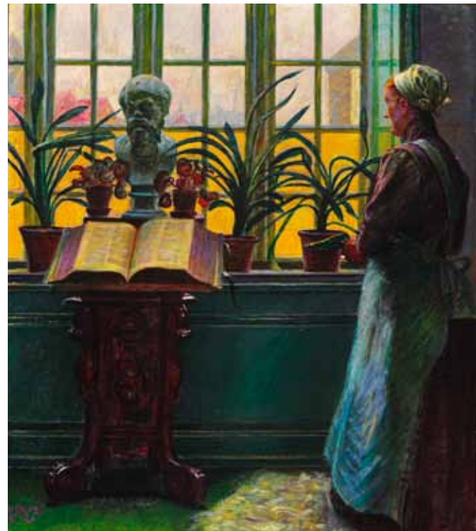
Ved Bibelbordet, 1912. Privateje