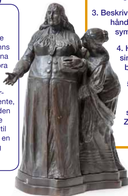
Leonora Christina forlader fængslet, 1907-10 Fuglsang Kunstmuseum

Skulpturen, man kan skimte i øverste højre hjørne af maleriet, er Zahrtmanns egen. Den forestiller Leonora Christina Ulfeldt, der forlader fængslet. Leonora Christina var Christian 4.'s datter. Hun sad fængslet i godt 22 år, fordi hendes ægtemand havde begået forræderi mod kongehuset, og man mente, at hun havde kendt til det. Hun var den historiske person, Zahrtmann skabte allerflest kunstværker af. Han så op til hende og fortolkede hendes liv som en fortælling om til sidst at bryde ud og blive fri på trods af modstand.