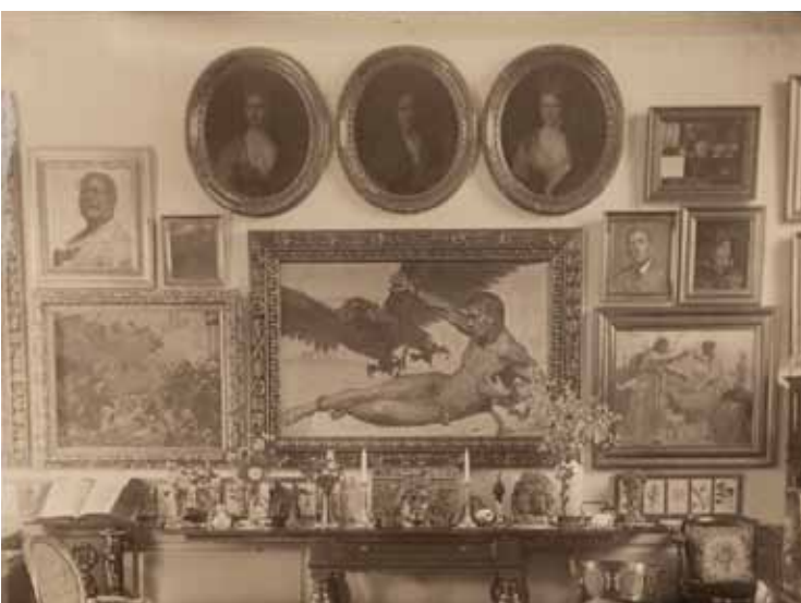
Fotografi fra Kristian Zahrtmanns hjem, 1912-17 Original i Den Hirschsprungske Samling