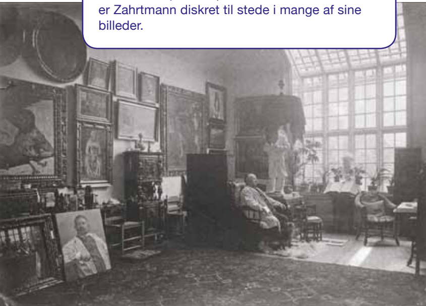
Kristian Zahrtmann i sit atelier i Casa d'Antino, 1912-17 Original i Bornholms Museum

Zahrtmann malede mange billeder i sit hjem på Frederiksberg. I mange af hans historiske malerier kan man faktisk genkende flere af hans egne kunstværker, møbler, krukker m.m. På den måde er Zahrtmann diskret til stede i mange af sine billeder.