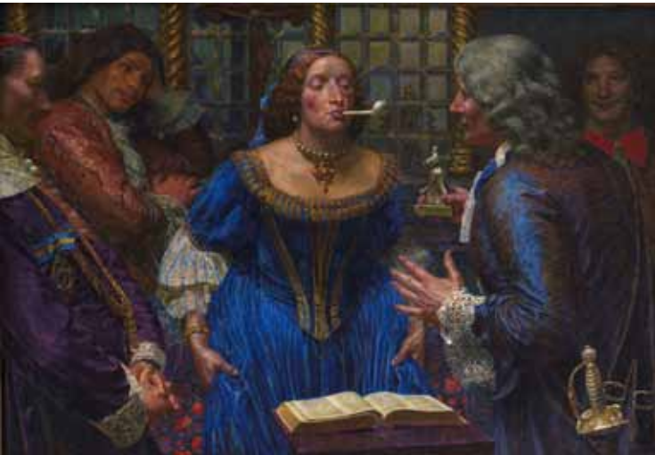
Dronning Kristina i Palazzo Corsini , 1908 Statens Museum for Kunst. www.smk.dk , public domain

Maleriet herunder forestiller den svenske dronning Kristina (1626-1689). Dronningen står i sit romerske palads omgivet af hofmænd. Med begge hænder løfter hun op i sin kjole for at varme bagdelen ved kaminen.