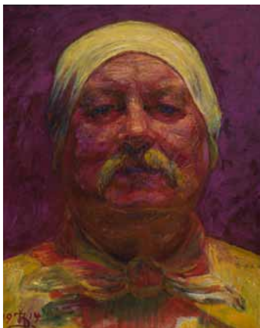
Selvportræt en face. Lampelys, 1914 Statens Museum for Kunst