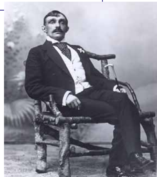
Johan Georg Heinrich Ludwig Tønnes Portræt af Herman Bang, 1890-1899

Den danske forfatter Herman Bang (1857-1912) levede samtidig med Zahrtmann. Hvor Zahrtmann hele livet holdt sin seksualitet privat, lagde Bang aldrig skjul på, at han var homoseksuel. Det gav ham mange knubs i offentligheden og i pressen, fordi det dengang var forbudt for en mand at have sex med andre mænd. Modsat Zahrtmann havde Bang derfor svært ved at blive anerkendt*, mens han levede. Siden er han dog blevet anerkendt som en af datidens største danske forfattere.