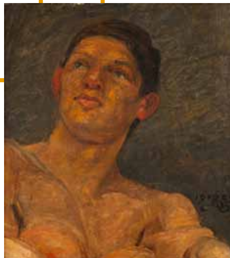
Studie til Menja, 1905

Inden Zahrtmann gik i gang med det færdige billede, malede han et studie af den mandlige model. I studiet kan man lige skimte et par påmalede bryster på den muskuløse mands overkrop.