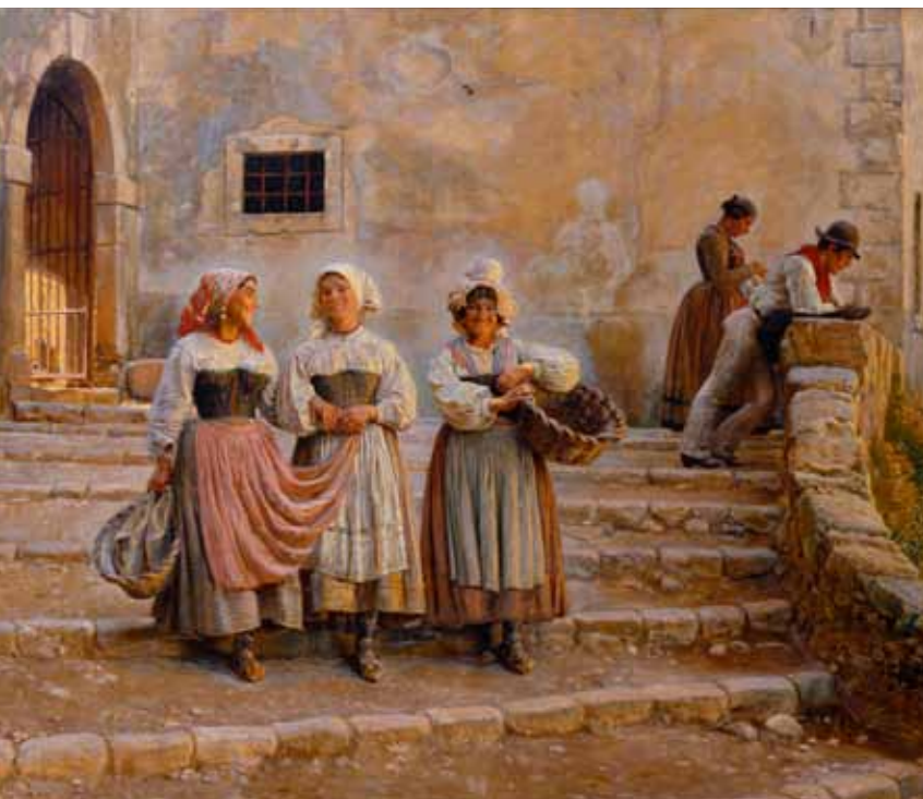
Piger som bærer kalk, 1883