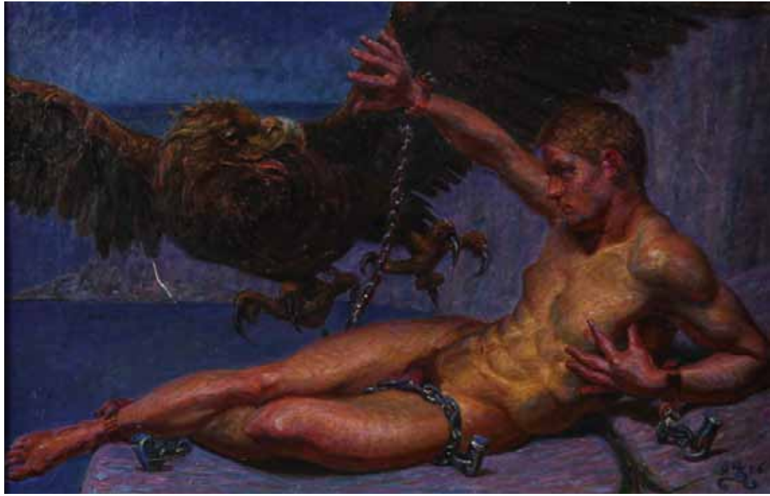
Prometheus, 1906. Privateje.

I billedet til højre har Zahrtmann malet den græske gud Prometheus, der er blevet straffet for at hjælpe menneskene ved at give dem ilden. Han er lænket til en klippe, og Zeus' ørn er på vej til at æde hans lever.