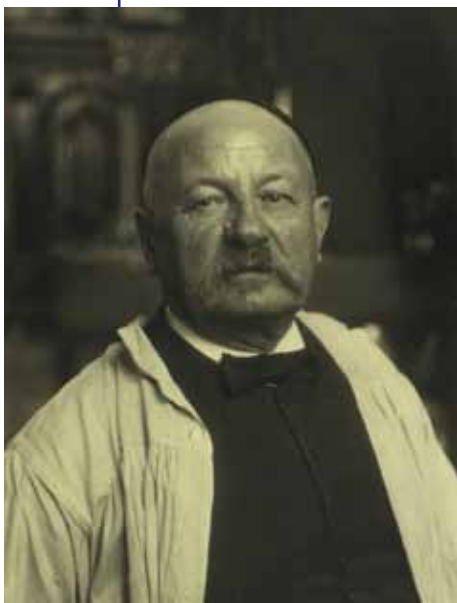
Portræt af Kristian Zahrtmann ca. 1900 Ukendt fotograf Det Kgl. Biblioteks billedsamling, public domain

I slutningen af 1800-tallet fik fotografiet sit brede, folkelige gennembrud. Nu var man ikke længere afhængig af en kunstner for at få skabt et billede af sig selv. Det var dog en langsommelig proces at tage et billede – slet ikke som vores tids hurtige og spontane snapshots med mobiltelefonen. Dengang havde kameraet en lang eksponeringstid, og man skulle sidde helt stille for at undgå, at fotografiet blev sløret. Derfor var tidens fotografier ofte nøje planlagte og iscenesatte.