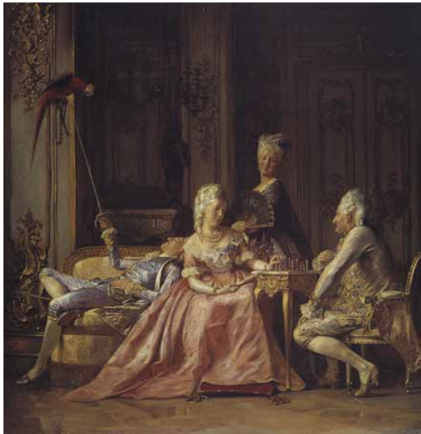
Scene fra Christian VII's hof , 1873

Med billedet pegede Zahrtmann på noget af en skandale: Dronning Caroline Mathilde havde nemlig en affære med hoflægen, Struensee. Juliane Marie, der står med viften i baggrunden, var med til at afsløre det hemmelige forhold.