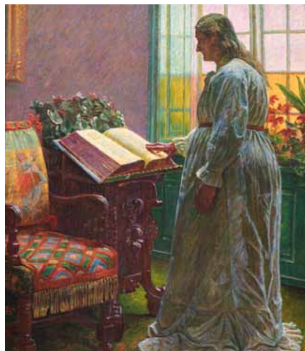
Leonora Christina i Maribo kloster, 1914 Fuglsang Kunstmuseum.

I dansk kunsthistorie* er der skrevet en del om Kristian Zahrtmann og hans kunst. Der er dog en gruppe af Zahrtmanns billeder, som vi meget sjældent ser eller hører om. Det er billeder, som viser mænd og kvinder, der ikke passer ind i normerne* for køn og seksualitet omkring år 1900. I nogle af dem er der homoseksuelle temaer. Andre steder bliver kønsrollerne* vendt på hovedet. Næsten alle disse billeder er i dag i privateje. De er med andre ord ikke på museerne, og derfor er der ikke så mange, som kender til dem. I dette materiale skal vi se nærmere på nogle af disse mindre kendte billeder fra Zahrtmanns hånd.