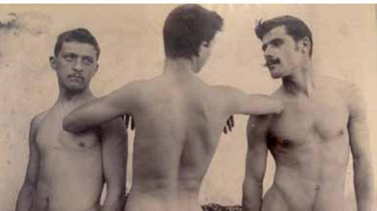
Under sagen konfiskerede politiet kærlighedsbreve skrevet til og fra mænd samt erotiske og pornografiske billeder af mænd. Her ses et af de konfiskerede billeder.

Zahrtmann havde mange venner, men vi ved ikke, om han havde noget kærlighedsliv. Han udtalte sig aldrig om sin egen seksualitet, men i flere af hans malerier er der homoseksuelle temaer. På Zahrtmanns tid var det forbudt at være praktiserende homoseksuel mand i Danmark. Man kunne endda risikere fængselsstraf. Det var derfor slet ikke ufarligt for en mandlig maler at male nøgenbilleder af andre mænd. Alligevel malede og udstillede Zahrtmann flere billeder af nøgne mænd – og selvom nogle af dem skabte forargelse, slap han afsted med det. I det følgende undersøger vi, hvordan det var at være homoseksuel mand i Danmark omkring år 1900. Vi undersøger også, hvordan Zahrtmann præsenterede homoseksualitet i sine billeder.