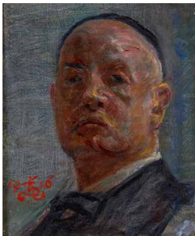
Selvportræt, 1916. Sorø Kunstmuseum