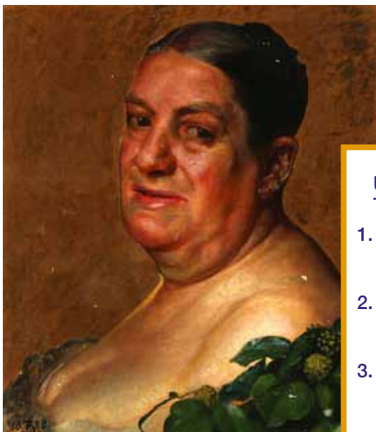
Madam Ullebølle som bacchantinde, 1888 Privateje.

I maleriet har Zahrtmann malet Ullebølle som bacchantinde. Bacchantinder var i den antikke græsk-romerske mytologi betegnelsen for de kvinder, som dyrkede guden Bacchus (også kaldet Dionysos). Bacchus var gud for vin og vilde fester.