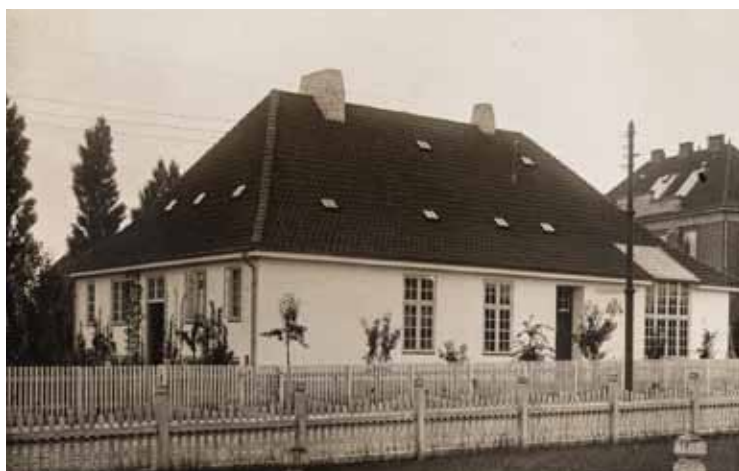
Zahrtmanns hus, Casa d'Antino