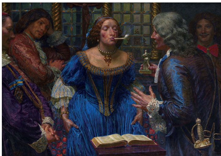
Dronning Kristina i Palazzo Corsini, 1908

Materialet sætter fokus på Kristian Zahrtmanns liv og kunst i forhold til det nutidige begreb queer . Ordet queer kommer fra engelsk og kan oversættes til 'skæv' på dansk. Queer kan både være noget, man gør, og noget, man er. Begrebet kan bruges til at beskrive handlinger, der udfordrer herskende forestillinger om køn og seksualitet. Det kan også være en fællesbetegnelse for personer, der ikke ser sig selv i forlængelse af samfundets normer for køn og identitet. Queer åbner op for, at identiteter kan være mere flydende og individuelle end de typiske 'identitetskasser', vi normalt putter os selv og hinanden i. I materialet anvendes queer-begrebet til at pege på det uventede og udfordrende i Zahrtmanns farverige kunst. Det gælder hans blik for smukke mænd og stærke kvinder såvel som hans iøjnefaldende selvportrætter.