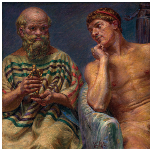
Sokrates og Alkibiades, 1911 Statens Museum for Kunst

Den gamle filosof Sokrates sidder med en guldskulptur i hånden, mens den unge Alkibiades ser optaget på ham. I antikkens Grækenland var mandlig homoseksualitet anset som noget, der kunne føre til den højeste indsigt. Helt anderledes var det på Zahrtsmanns tid, hvor homoseksualitet var ulovligt og sygeliggjort. I maleriet har Zahrtsmann anvendt en fortidig situation til at kommentere på sin egen samtid. Manden, som stod model til Alkibiades, var nemlig en af de homoseksuelle mænd, der blev retsfulgt under Den store Sædelighedssag i årene 1906-07.