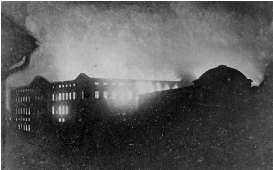
Figur 1, fotografi fra 4. oktober 1884. Christiansborg brænder

Det må have været vildt at være med til. Som man kan læse et andet sted i Branden bærer folk kunstværker ud af det brændende slot. Det var nemlig her, at Kongens Malerisamling lå. Stort set hele samlingen blev reddet, nogle skulpturer gik tabt, men ved mange af dem havde man heldigvis stadig en gipsmodel eller en støbeform at kunne reproducere ud fra. Efter branden på Christiansborg blev Statens Museum for Kunst bygget, og her flyttede Kongens Malerisamling ind.