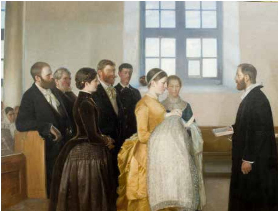
Michael Ancher, En Barnedaab , 1883-1888