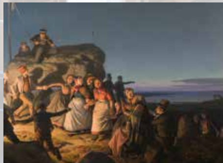
Jørgen Sonne: Sct Hans Aften , (1860)

I slutningen af 1800-tallet flyttede mange mennesker ind til byerne, som en del af den øgede industrialisering. Det Moderne Gennembruds forfattere skrev om byerne og menneskemylderet, men de skildrede også livet på landet. Livet på landet var ofte blevet skildret som meget idyllisk og harmonisk, fx i som her i Jørgen Sonnes Sct Hans Aften (1860):