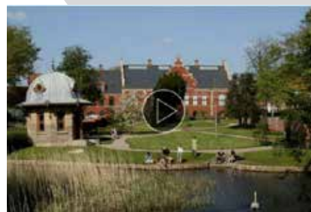
Se traileren om Ribe Kunstmuseum (1:31)