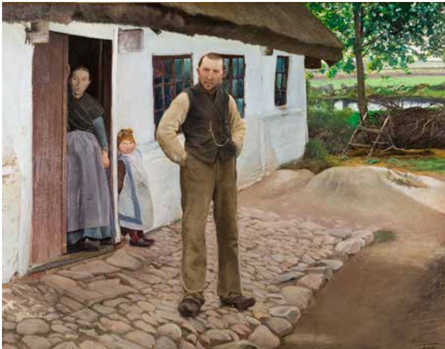
L.A. Ring, Husmandsfolk , 1897