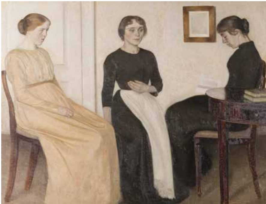
Vilhelm Hammershøi, Tre unge kvinder , 1895