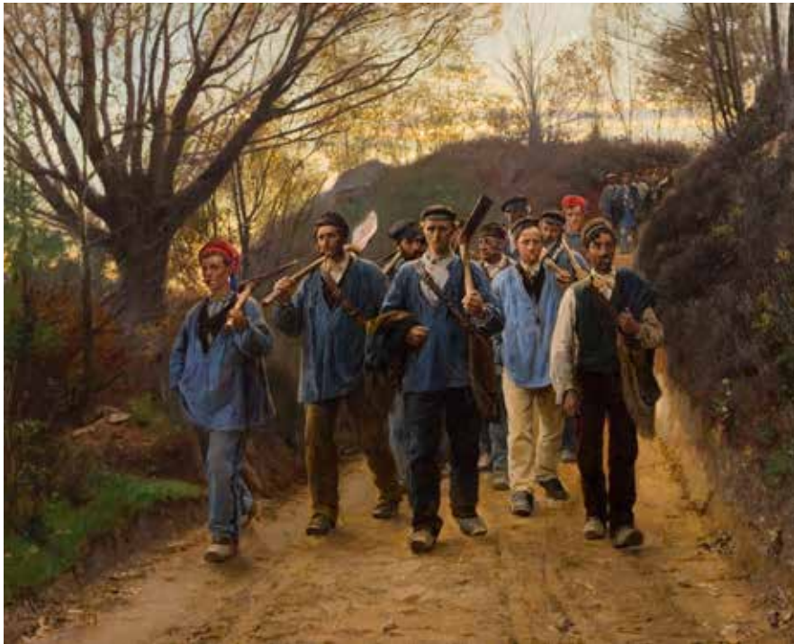
P.S. Krøyer, Franske arbejdere i hulvej , 1879