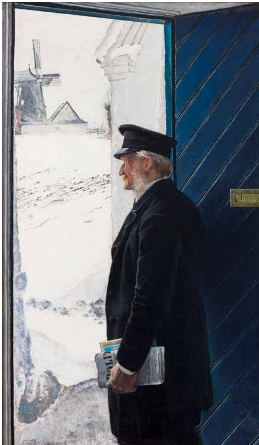
L.A. Ring, Stygt Vejr , 1908