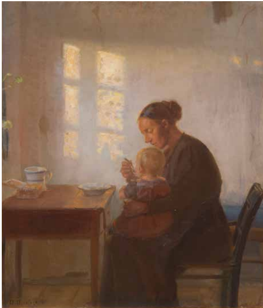
Anna Ancher, En mor med sit barn i en sollys stue , 1903-1907