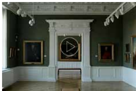
Se filmen om hvordan museet fik sin store kunstsamling (2:58)