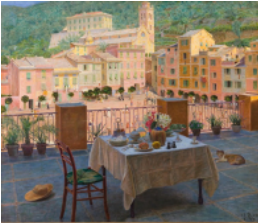
Kristian Zahrtmann: Mit Frokostbord i Portofino , 1900